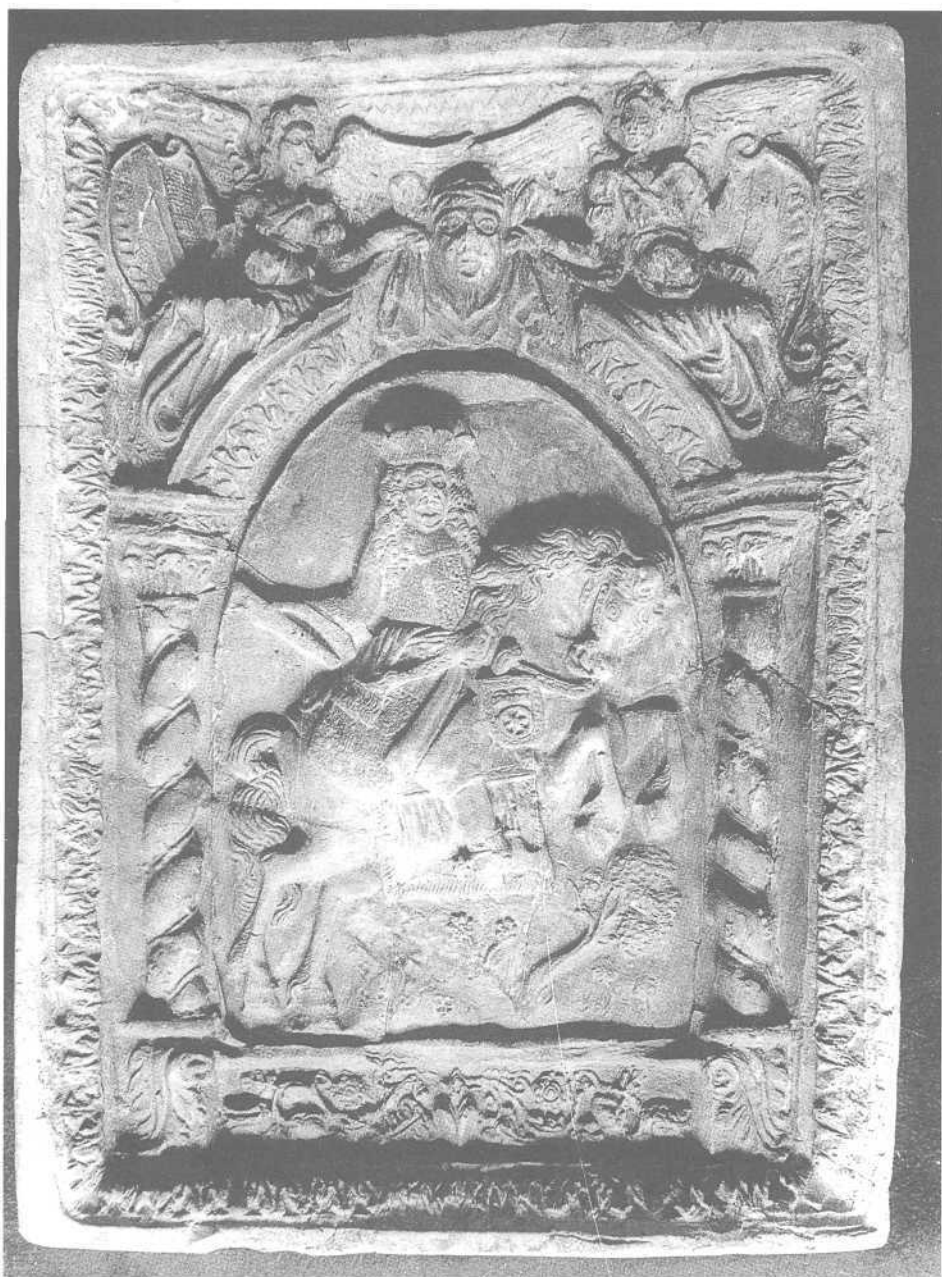
Abb. 1 Kurfürstentafel aus der Entengasse/Kirchgasse in neurestauriertem Zustand (Albgaumuseum Ettlingen)